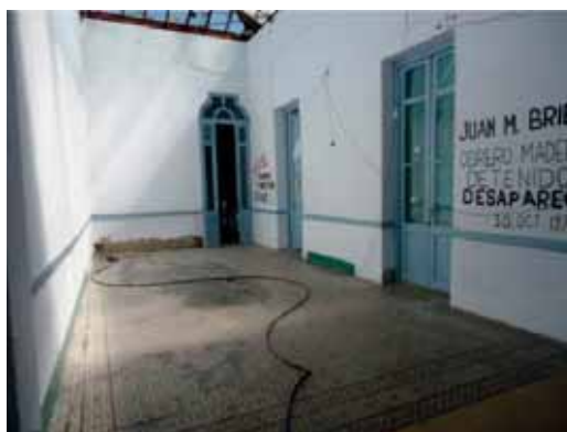
Mosaikkilattia pääsi oikeuksiinsa.

Lomaviikon aikana porukka hajosi sitten kahtia. Toinen puoli lähti Argentiinaan ja toinen ryhmä Jaureguiberriin, joka on Uruguayn opettajien ammattiliiton Federacion Uruguaya de Magisterio Trabajadores de Educacion Primaria (Fumtem) kesäviettopaikka.