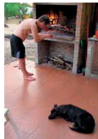
Perroksi (=koira) nimeämämme vahti ja seuralainen oli aina paikalla, kun alkoi asadon sytytys ja illallisen laitto.

Veijo Mikkola, Ao 200