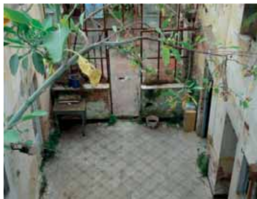
Seinät kasvoivat läpi pajua.