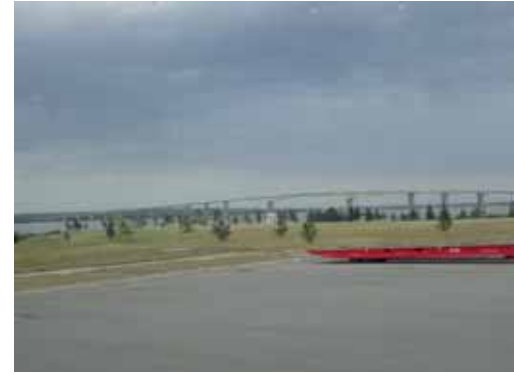
Fray Bentosin sellutehdas raaka-aine pinoineen ja kuuluisa silta, jonka Argentiinlaiset sulkivat vastalauseeksi tehtaan tulolle.

Ryhmäläisten keskuudessa kävimme keskustelua siitä, kuinka suhtautua vierailuun, koska Suomessa olimme saaneet lukea paperiteollisuuden piirissä tapahtuvien massiivisten tuotantolaitosten alasajoista. Vierailun olisi voitu jättää tekemättäkin, koska varsinaiseen tehtaaseen tutustuminen tapahtui bussissa istuen, saati että olisi tavattu ensimmäistäkään työntekijää.