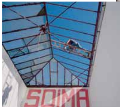
Vastaanottoaula sai uuden katon.