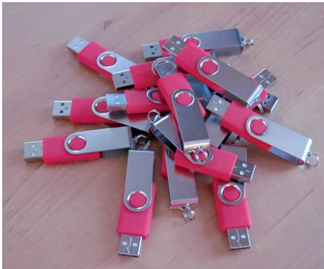
Tikussa asiaa – työelämän perusasioita pähkinänkuoressa vastavalmistuneille.