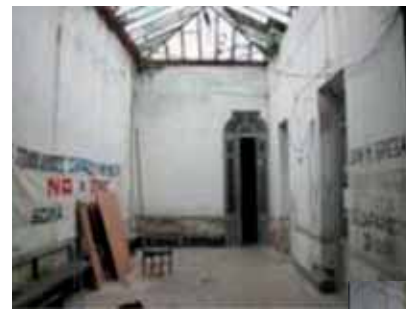
Talkooporukan saneerauskohte ennen fiksausta.

PIT-CERRO on rakennettu raunioituneelle teollisuusalueelle ja on kaupungin ja yritysten teollisuuspuisto. Alueella toimii noin 70 eri alojen pk-yritystä, joissa työskentelee yli 200 henkilöä. Pääsimme käymään viidessä niistä: elintarvikealan yrityksessä, sähkönjakokeskuksia valmistavassa yrityksessä, pullo-