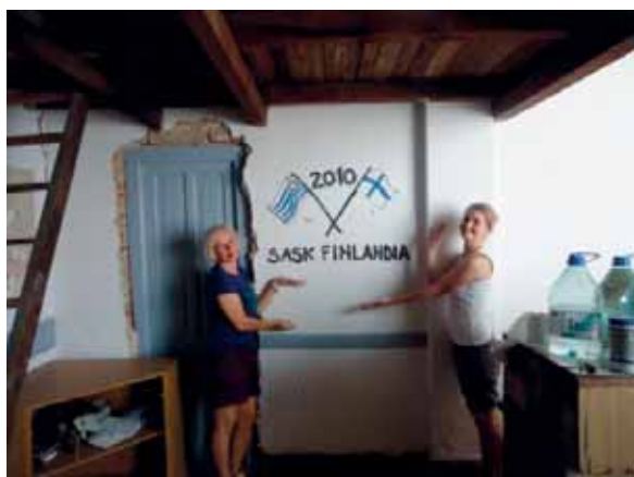
Taitelijat ovat maalanneet muistokuvan talkoomatkasta.